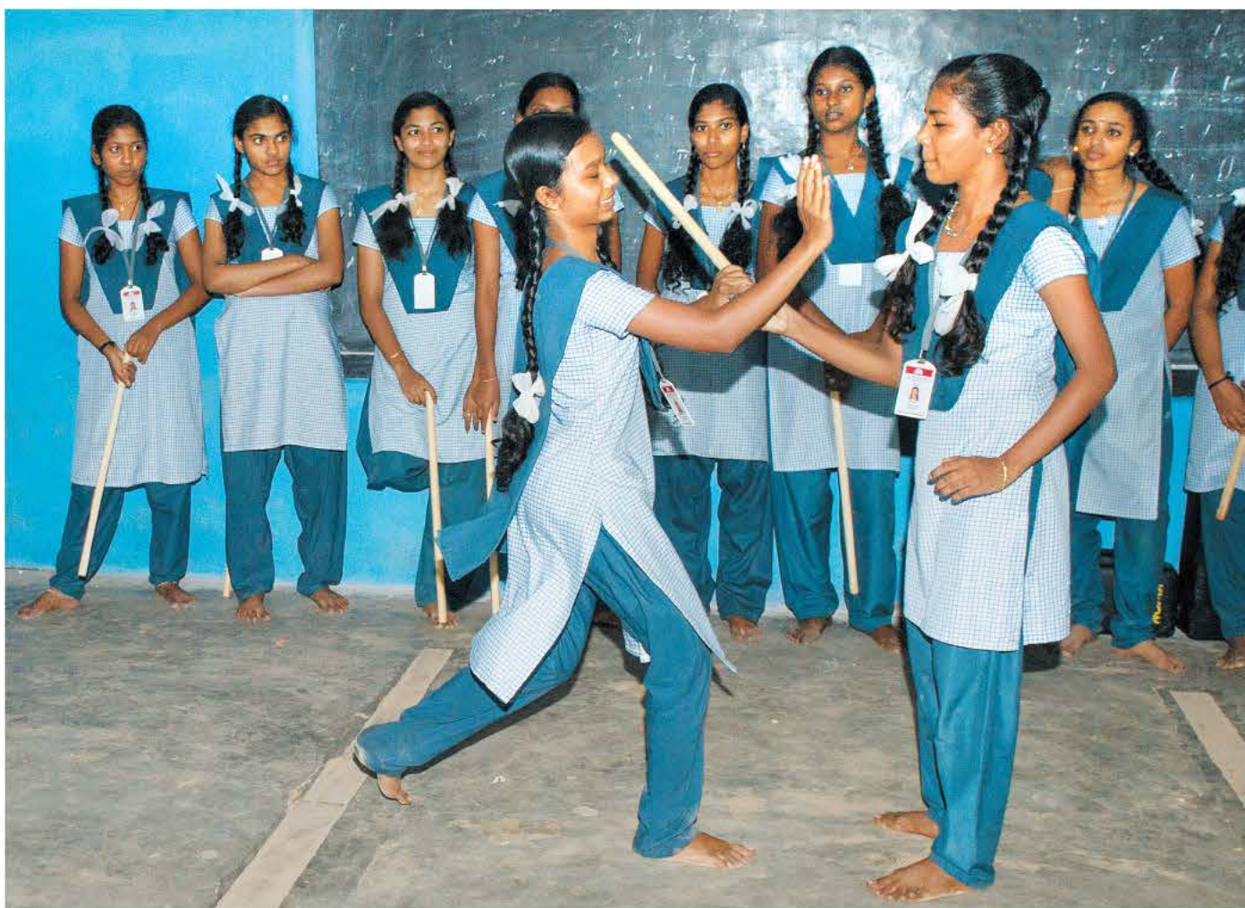
Sonnenschutz: Indische Frauen haben immer einen Schirm dabei. Den Stock können sie notfalls auch zum Schutz vor Gewalt einsetzen.