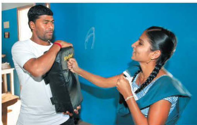
Nirgendwo sicher: In kaum einem Land werden Frauen so oft Opfer von Gewalt wie in Indien.

Revolution“, wenn Frauen sich wehren. Zu tief verwurzelt sind die seit Jahrhunderten bestehenden Diskriminierungen von Frauen, zu wenig akzeptiert sind sie als vollwertige Menschen. Weiblicher Widerstand rüttelt an den Grundfesten der indischen Gesellschaft. „Uns war von Anfang an bewusst, dass Selbstverteidigung ein sehr heikles Thema ist, das eine Menge Fingerspitzengefühl benötigt“, sagt Kasselmann. Immerhin war die gebürtige Niederländerin, die früher als Lehrerin arbeitete, ebenso wie Dirk Witte bereits ortskundig. Kasselmann hat, seit sie vor sechs Jahren das erste Mal nach Indien reiste und die maroden